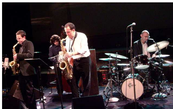
Concert à Radio France, le 11 mars 2006